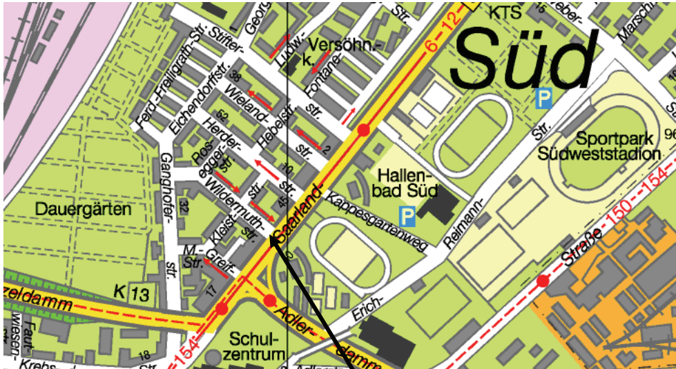
Abschnitt zw. Saarländ- und Kleiststraße