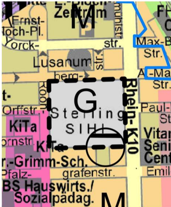
Darstellung FNP '99