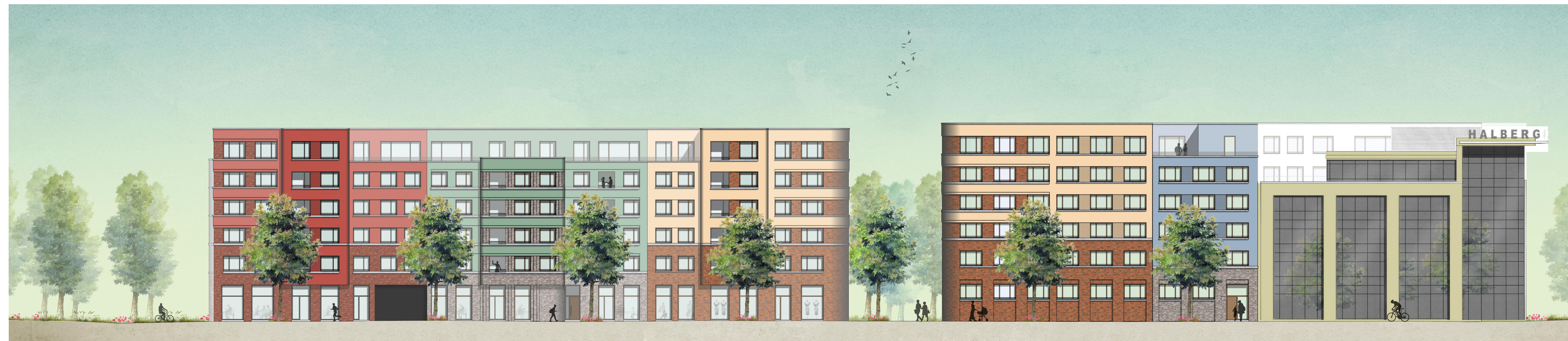
Ansicht Ost / Rheinallee