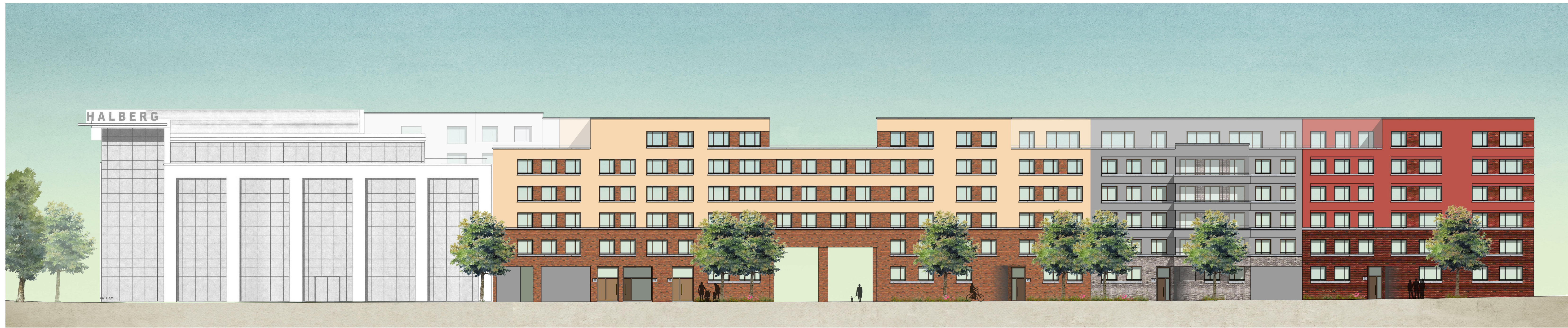
Ansicht Nord / Halbergstraße