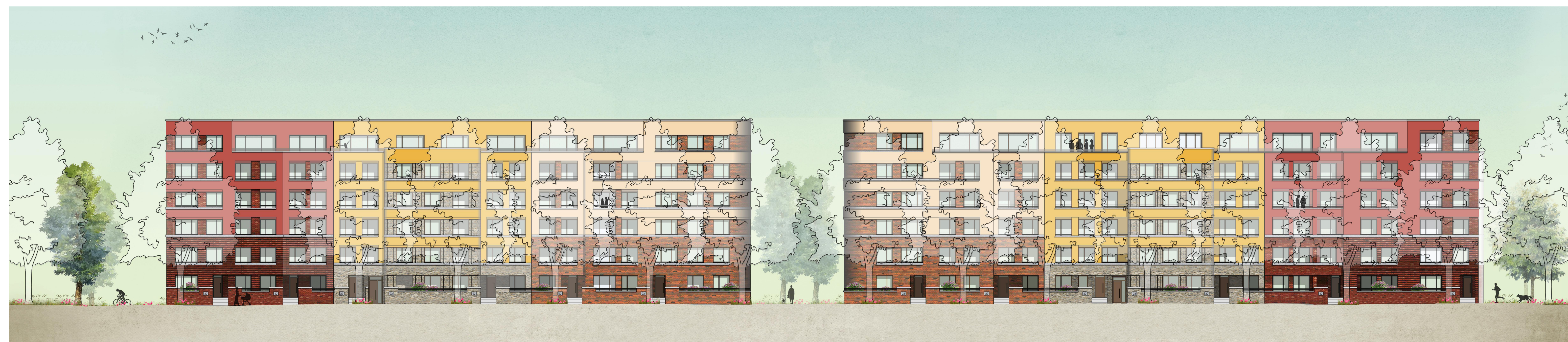
Ansicht West / Roonstraße