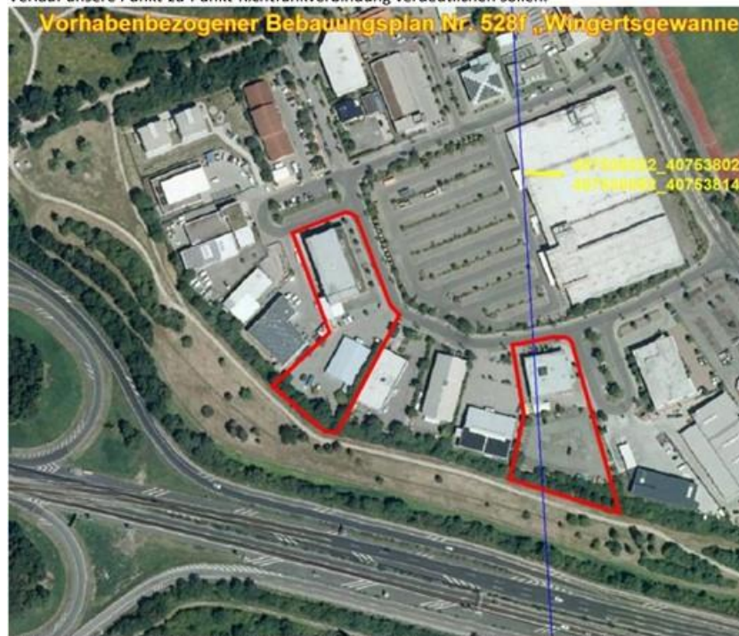
Die farbige Linie versteht sich als Punkt-zu-Punkt-Richtfunkverbindungen der Telefónica

Zur besseren Visualisierung erhalten Sie beigefügt zur E-Mail ein digitales Bild, welches den Verlauf unsere Punkt-zu-Punkt-Richtfunkverbindung verdeutlichen sollen.