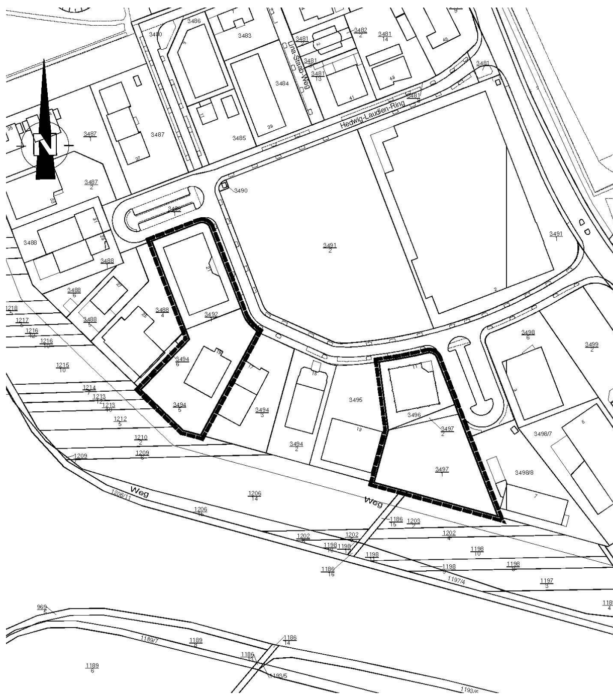
Abb. 1: Geltungsbereich des vorhabenbezogenen Bebauungsplanes Nr. 528f „Wingertsgewanne – Elektrofachmarkt Hirsch und Ille, 1. Änderung“, ohne Maßstab.