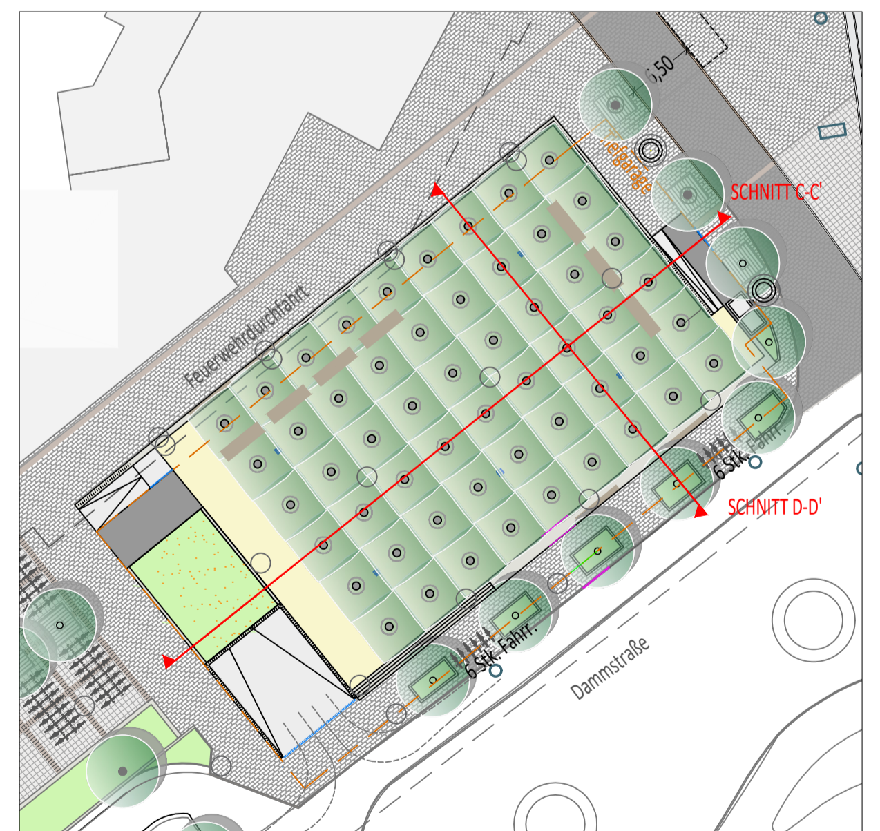
LAGEPLAN, M: 1:500