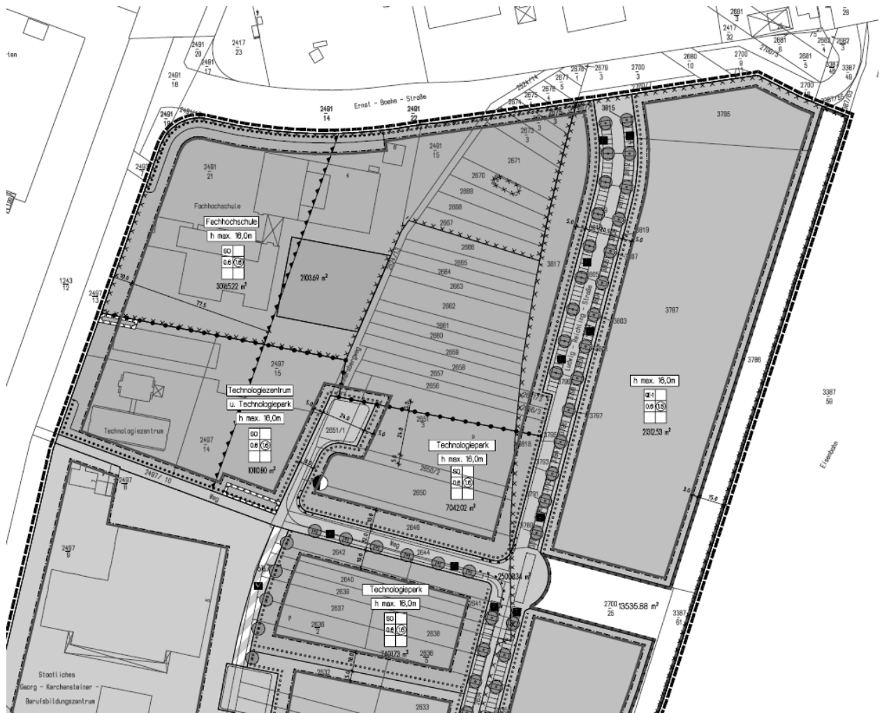
Auszug aus der Planzeichnung des Bebauungsplans Nr. 583 „Ludwig-Reichling-Straße“