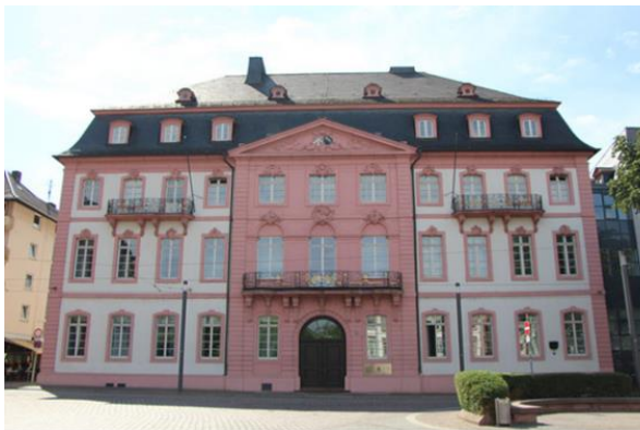
Bassenheimer Hof, Landeshauptstadt Mainz