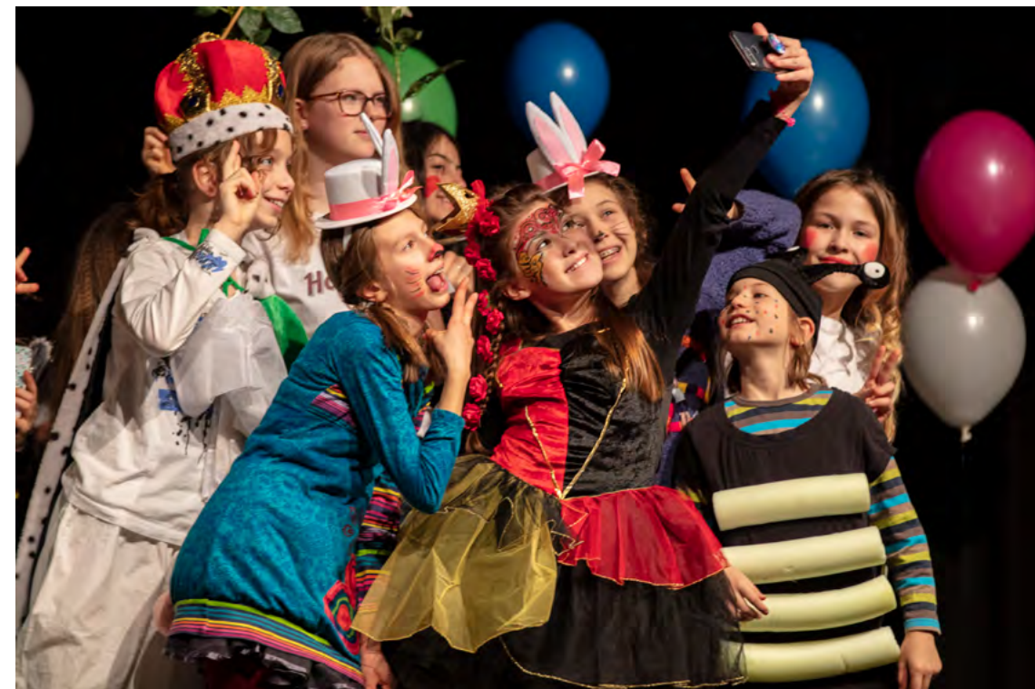
2019 - ALICE IN WUNDERLAND - gemeinsame Inszenierung von Kinder und TEEN#s THEATERKURSE