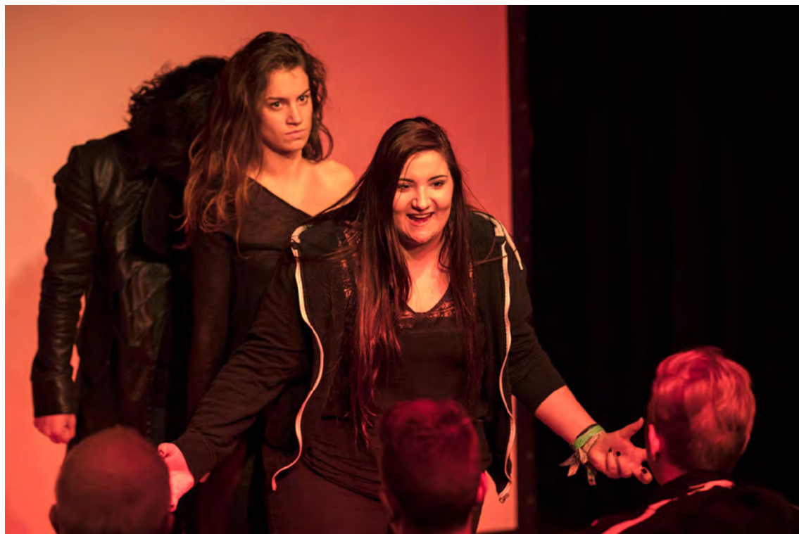
7 FRAU KOMA KOMMT - 2017 ausgezeichnet mit einem Goldenem Vogel und PAPAGENO AWARD für Beste weibliche Hauptrolle durch Reiman Akademie in Linz