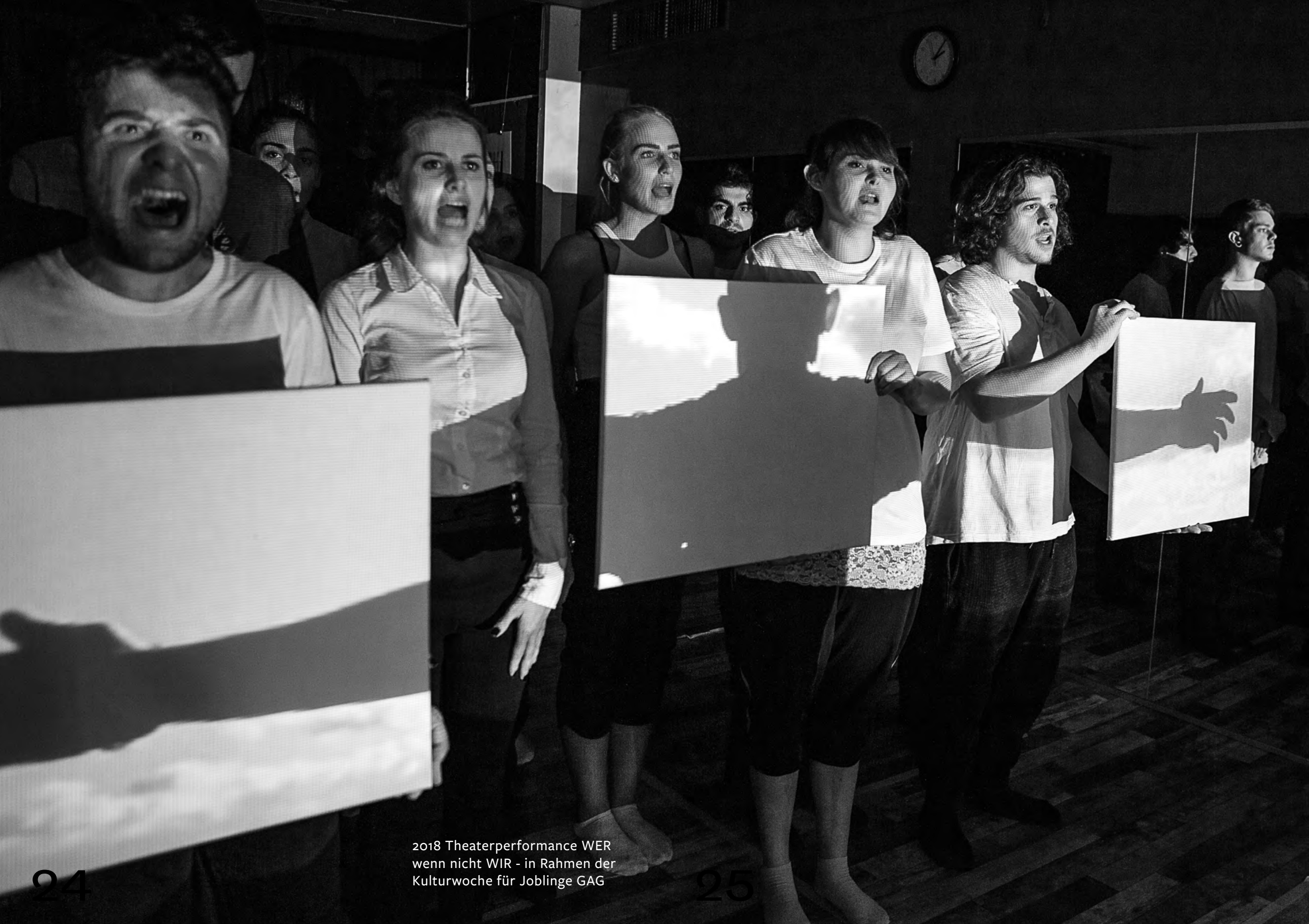
2018 Theaterperformance WER wenn nicht WIR - in Rahmen der Kulturwoche für Joblinge GAG