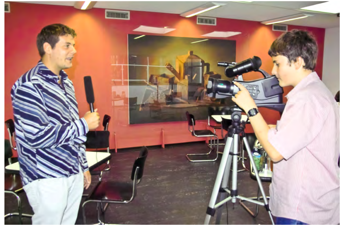
↗ THEATERWERKSTATT in Action