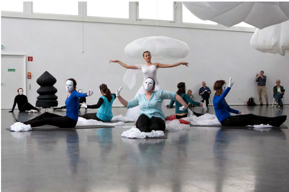
↗ 2012 - Körpertheater -Performance zur Ausstellung "zwischen Himmel und Erde" von Bettina Bürkle und Klaus Illi für den Kunstverein Ludwigshafen