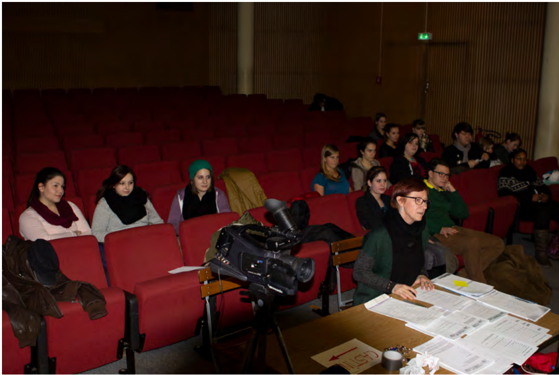
↗ 2014 Probeaufnahmen für neue Inszenierung REICH UND SCHÖN