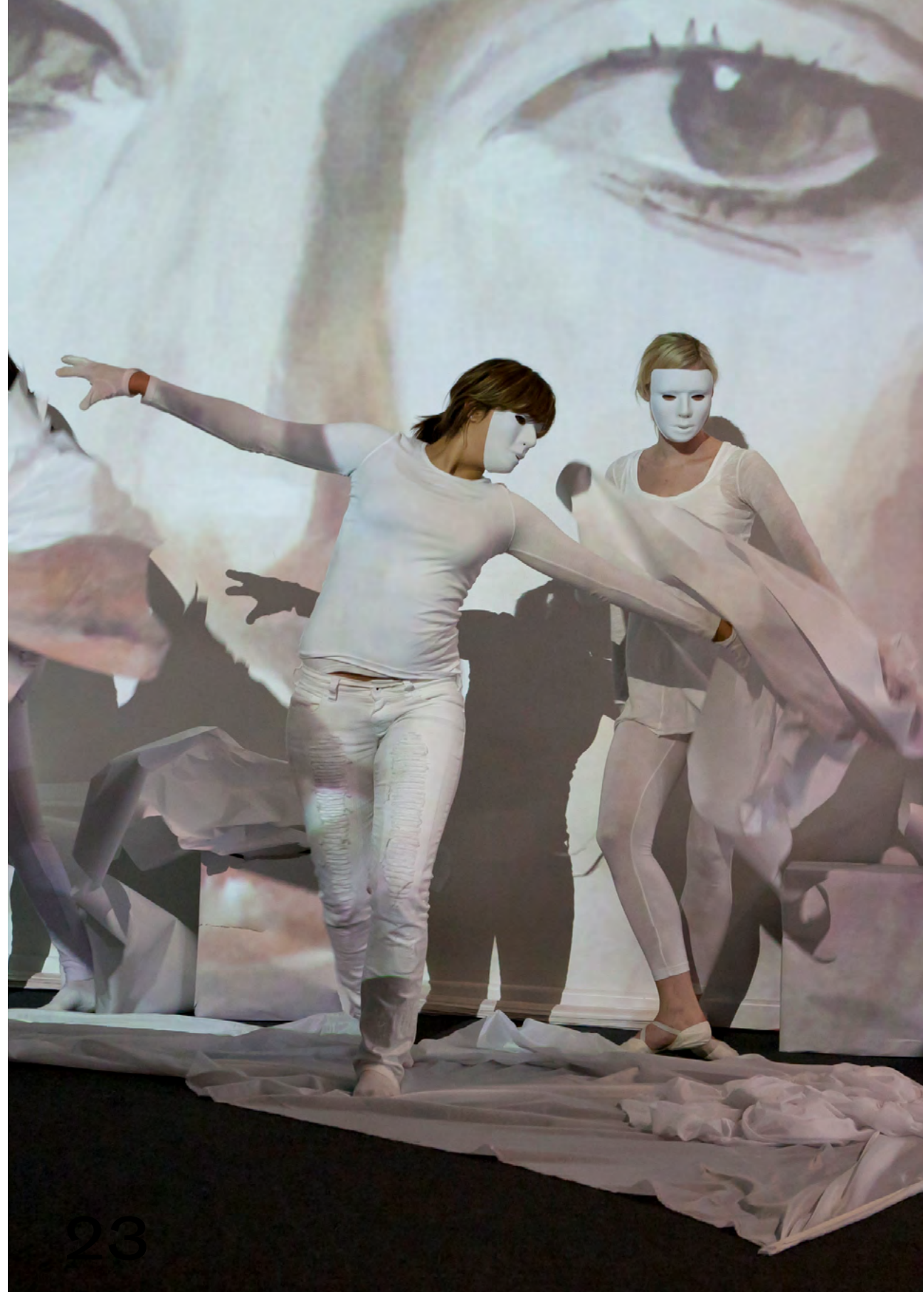
→ 2011 - Körpertheater RAP trifft KUNST in Rahmen der Langen Nacht der Museen für das Wilhelm Hack-Museum