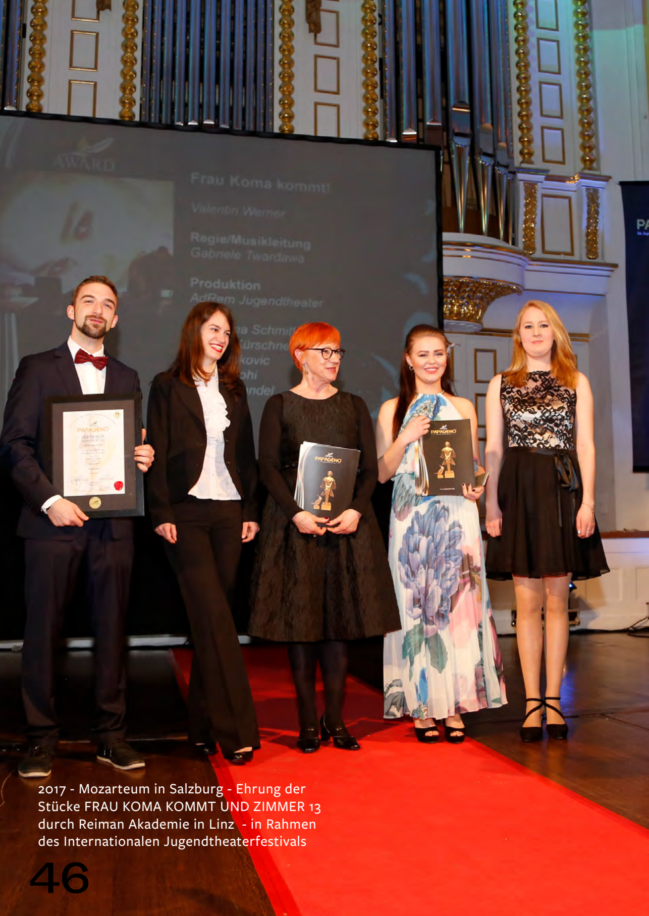
2017 - Mozarteum in Salzburg - Ehrung der Stücke FRAU KOMA KOMMT UND ZIMMER 13 durch Reiman Akademie in Linz - in Rahmen des Internationalen Jugendtheaterfestivals