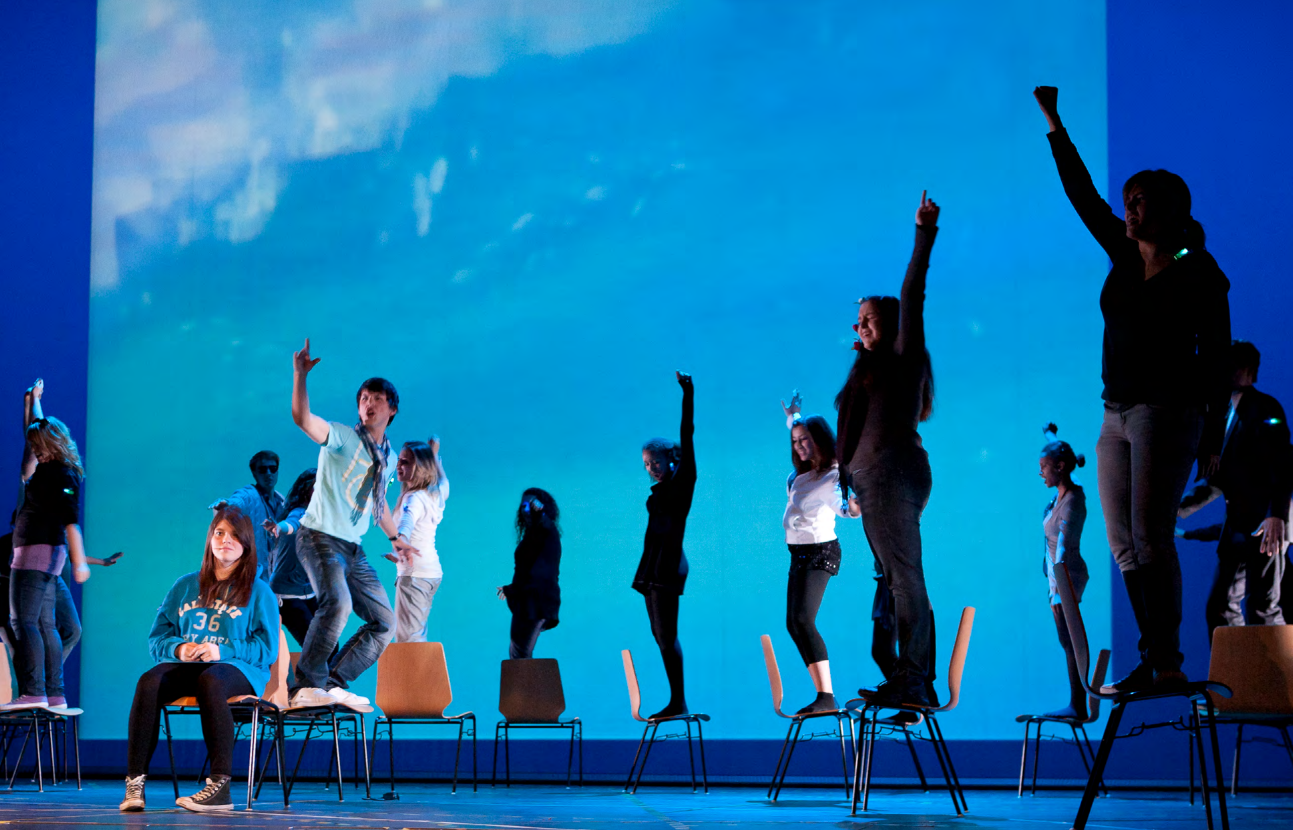
2011 - real.life - Theater in Pfalzau