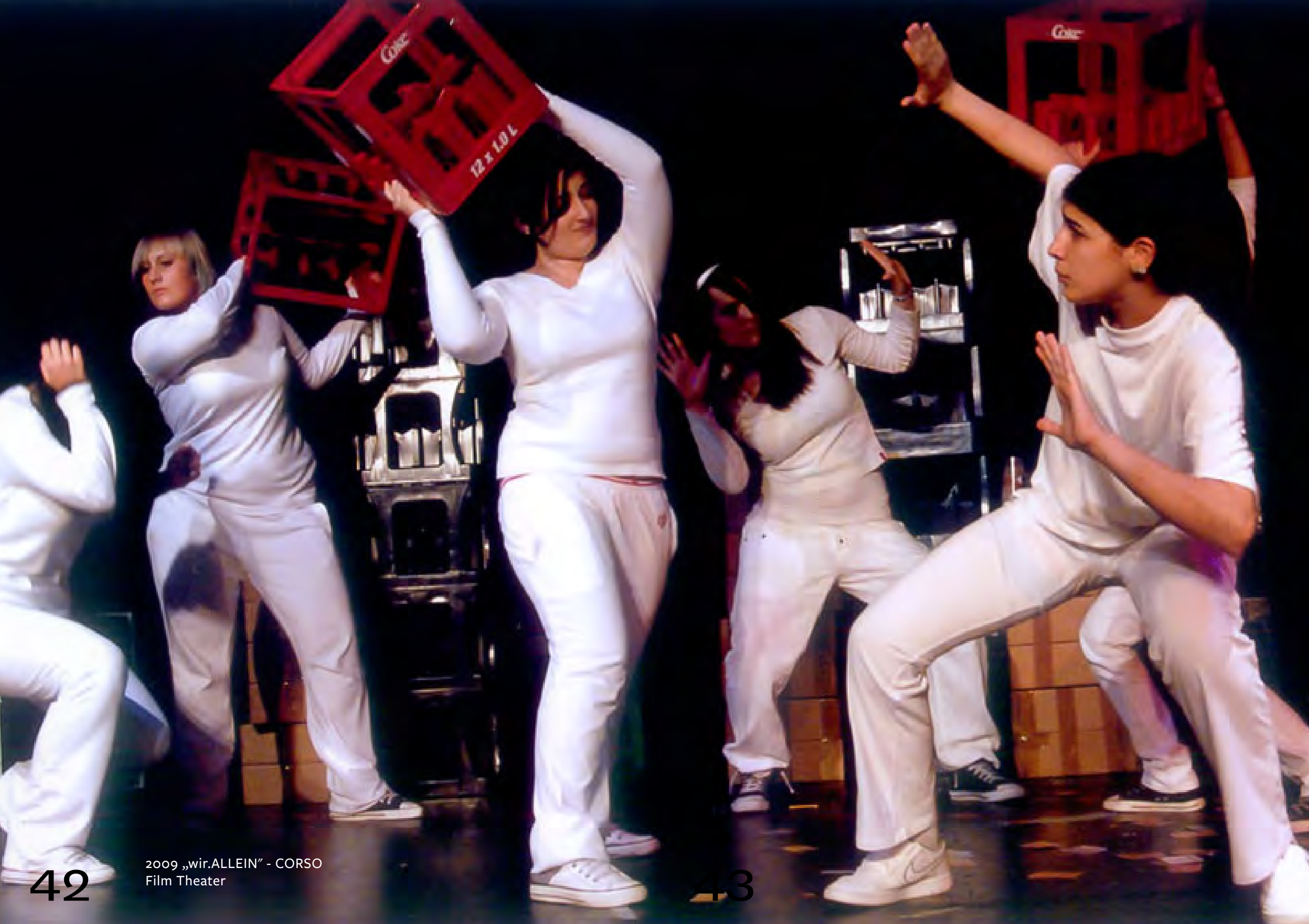
2009 „wir.ALLEIN“ - CORSO Film Theater